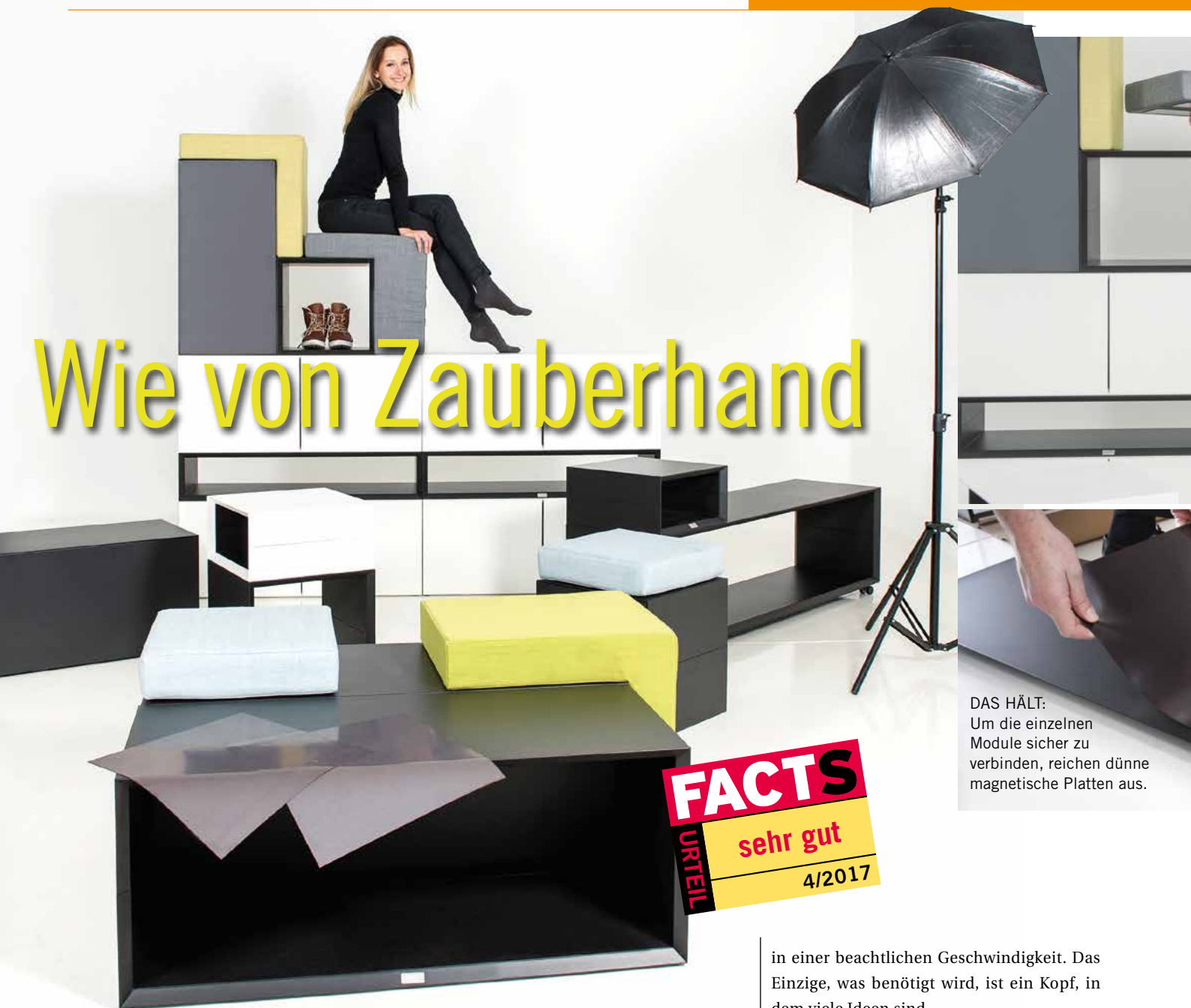
DAS HÄLT: Um die einzelnen Module sicher zu verbinden, reichen dünne magnetische Platten aus.