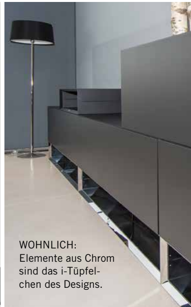
WOHNLICH: Elemente aus Chrom sind das i-Tüpfel- chen des Designs.