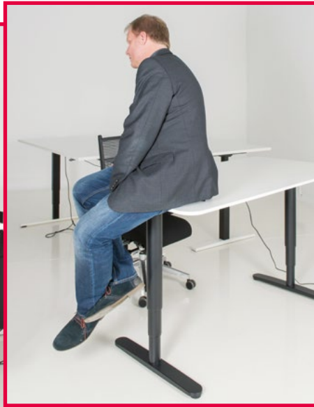
BELASTUNGSPROBE: Im FACTS-Test mussten die höhenverstellbaren Schreibtische so einiges aushalten.