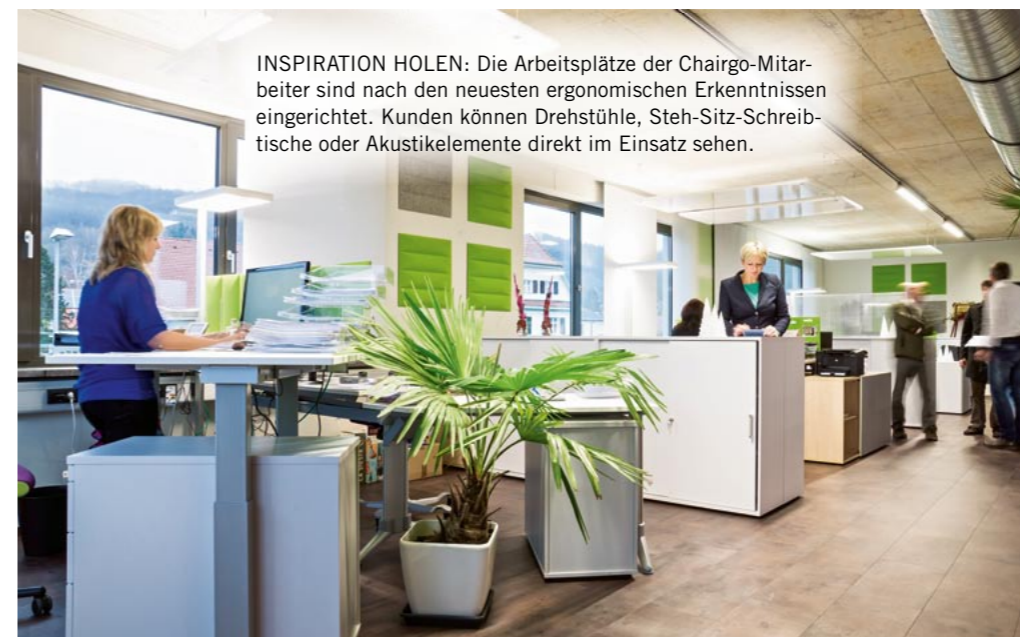
INSPIRATION HOLEN: Die Arbeitsplätze der Chairgo-Mitarbeiter sind nach den neuesten ergonomischen Erkenntnissen eingerichtet. Kunden können Drehstühle, Steh-Sitz-Schreibtische oder Akustikelemente direkt im Einsatz sehen.

Um diese zu erreichen, ist eine optimale und individuelle Beratung unumgänglich. „Wir sind engagierte Produktexperten, die mit viel Einsatz und Freude den Kunden beraten“, >