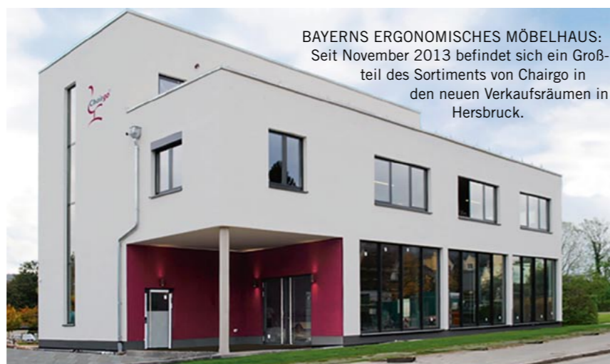
BAYERNS ERGONOMISCHES MÖBELHAUS: Seit November 2013 befindet sich ein Großteil des Sortiments von Chairgo in den neuen Verkaufsräumen in Hersbruck.

ternehmen Chairgo deshalb hauptsächlich Sitzmöbel, Schreibtische und ergänzende Produkte mit dem Konzept des bewegtdynamischen Sitzens und Arbeitens. „In Gesprächen mit einem befreundeten Hersteller